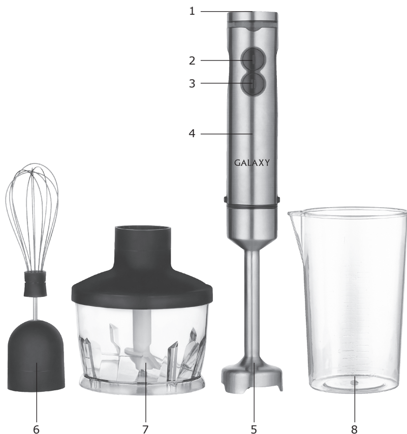
Элементы электроприбора (рис. 1):